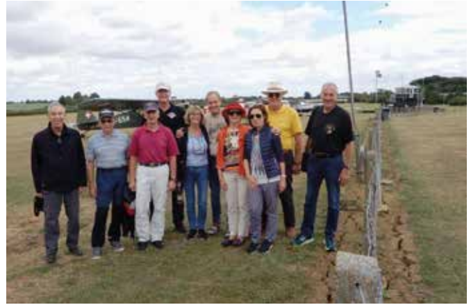
AAA goes UK

wir einfach romantischer. Dazu bieten wir jeweils Grill und Getränke, und tauschen Fliegergeschichten. Beide Anlässe, im Juni und September waren gut besucht und werden auch in Zukunft weiter angeboten.