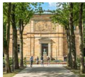
Richard Wagner Museum