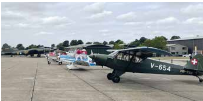
AAA Flugzeuge in Duxford (Sommerreise)

Wir sind ja ein Aviatikverein, und weil wir unser Glück gerne teilen, bieten wir seit einiger Zeit Schnuppertage an, jeweils im Frühling und im Herbst. Wir möchten Neulingen zeigen, dass richtiges Fliegen, die hohe Kunst des Landens mit Heckradflugzeugen gelernt wird. Fliegen in der Art der Grossväter finden