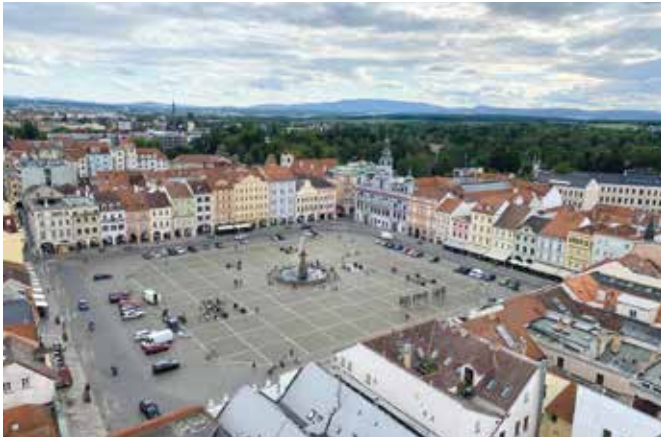
Ceske Budejovice (Budweis) Zentrum vom Schwarze Turm